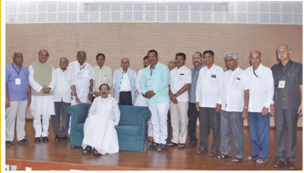
ಗೌರವಾನ್ವಿತ ಉಪರಾಷ್ಟ್ರಪತಿಗಳೊಂದಿಗೆ ಕೆಎಲ್‌ಇ ಸಂಸ್ಥೆಯ ಆಡಳಿತ ಮಂಡಳಿಯ ಸದಸ್ಯರ ಒಂದು ನೋಟ.